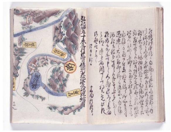
「弘化四年丁未三月廿四日信州大地震地理縮図」 卷三十三下（第三十三冊）