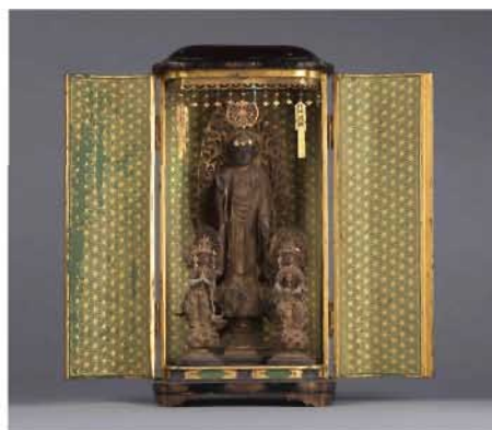
阿弥陀三尊像(黒漆厨子入) 室町時代 16世紀