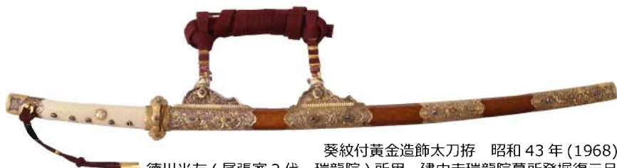
葵紋付黄金造飾太刀拵 昭和43年(1968) 徳川光友(尾張家2代、瑞龍院)所用 建中寺瑞龍院墓所発掘復元品