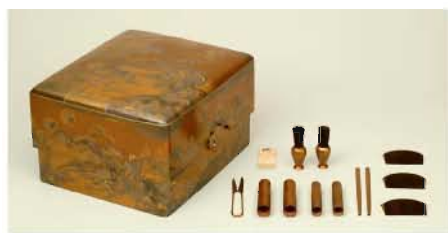
国宝 初音時絵櫛箱 江戸時代 寛永16年(1639) 千代姫(尾張家2代光友正室、靈仙院)所用 建中寺奉納品