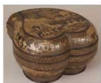
楼閣人物図螺鈿桃形食籠