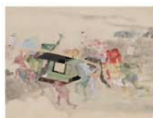
武大夫物語絵巻 三巻の内 下巻(部分)