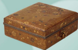
薩梅時絵手箱 室町時代 16世紀