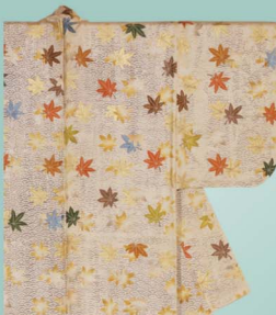
白地青海波に紅葉文縫箔(部分) 江戸時代 18世紀