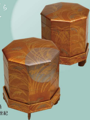
武蔵野時絵貝桶 江戸時代 17世紀

咲き誇る花、花を散らす風や雨、煌々と照る秋の月、降りつもる冬の雪など、自然がみせる美しい風物。移りゆく自然の美しさに惹かれた人々は、これらに心を寄せて詩歌に詠み、自らの心情を投影してきました。また絵画に描きあらし、工芸品を彩る要素としても、日本のみならず東洋の美的生活を支える基盤となってきました。