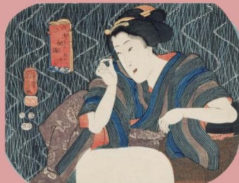
歌川国芳 註文御詠染あいねつみ 団扇絵判錦絵 嘉永5年(1852) 名古屋市博物館蔵