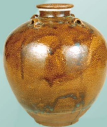
唐物茶壺 銘夕立 大名物 徳川家康・徳川義直(尾張家初代)所用 中国・南宋～元時代 13-14世紀