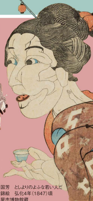
歌川国芳 としよりのよふな若い人だ 大判錦絵 弘化4年(1847)頃 名古屋市博物館蔵

表面 上段/牡丹図屏風 八曲一雙の内左隻 下段/右から 月岡芳年 雪月花の内月 市川三升 毛剃九右衛門 大判錦絵三枚統 明治23年(1890)/月岡芳年 風俗三十二相 にくらさう 名古屋嬢之風俗 大判錦絵 明治21年(1888) 名古屋テレビ放送株式会社蔵