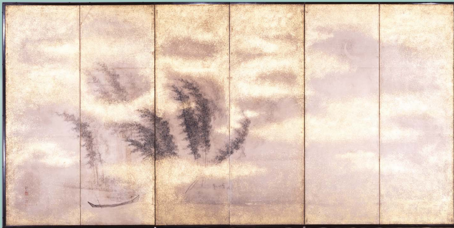
竹林残月図屏風 田中訥言筆 江戸時代 19世紀 個人蔵

雪月花をはじめ、風や雨など変化に富んだ自然現象に注目して、古典文学や絵画・工芸にみられる風雅の世界を紹介します。