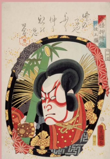
歌川国貞 今様押絵鏡 竹拔五郎 大判錦絵 万延元年(1860) 名古屋市博物館蔵

本展では、浮世絵において、誰を描くか、どのように描くかなど、さまざまな視点から浮世絵の人物表現の諸相を、徳川美術館、名古屋市博物館、そして名古屋市蓬左文庫のコレクションから紹介します。