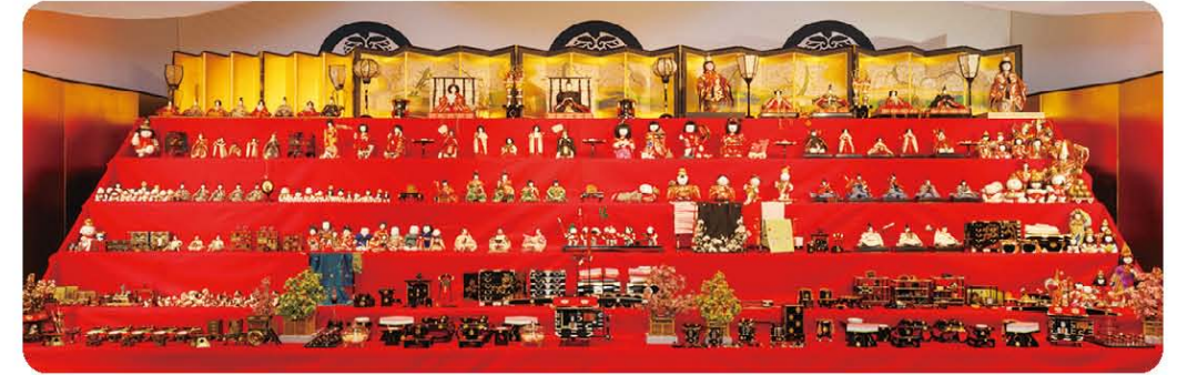
「尾張徳川家三世代の雛段飾り」