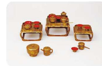
「鉄線唐草壽輪雛道具 懸籠」