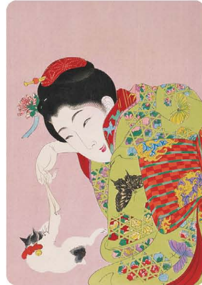
「真美人」 楊洲周延画