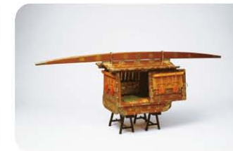
「菊折枝壽輪雛道具 乗物」 後藤院頼君(尾張家11代齊温継室)所用