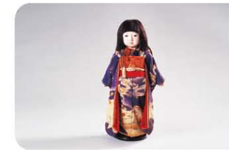
「市松人形」 瀧沢光鶴著作