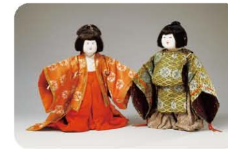
「御所人形(若君権君)」