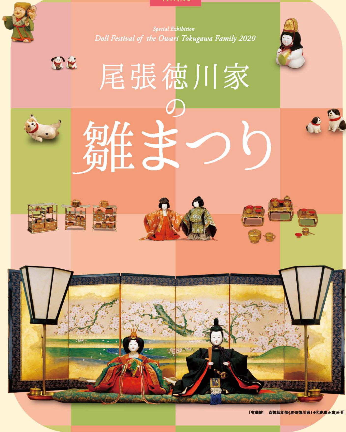
「有業筆」貞徳院姫(尾張徳川家14代慶勝正室)所用