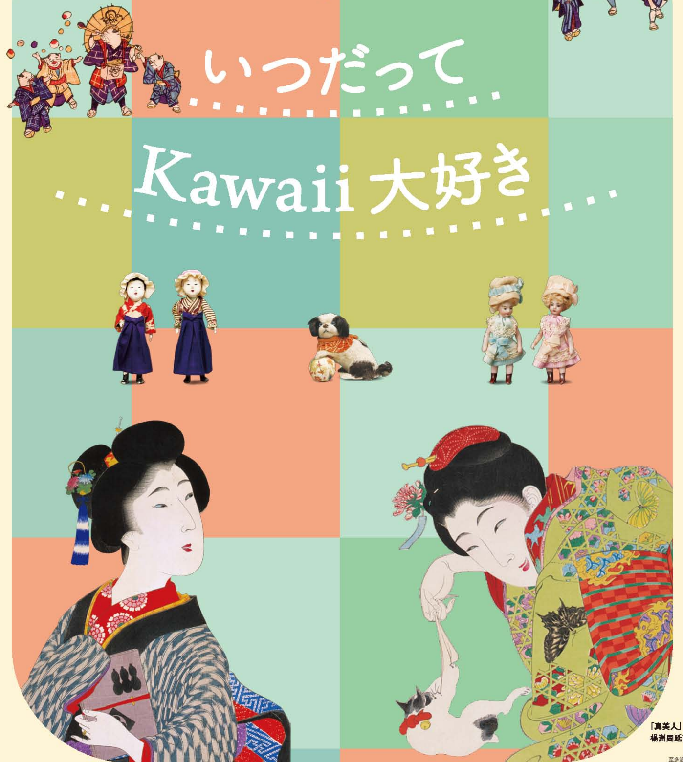
「真美人」 楊洲周延画

Thematic Exhibition The Timeless Appeal of 'Kawaii' / 'Cute' Culture