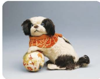
「毛植え人形 犬」 西光庵寄贈