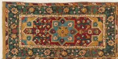
八星メダイオン文絨毯 インド 18世紀 【通期】