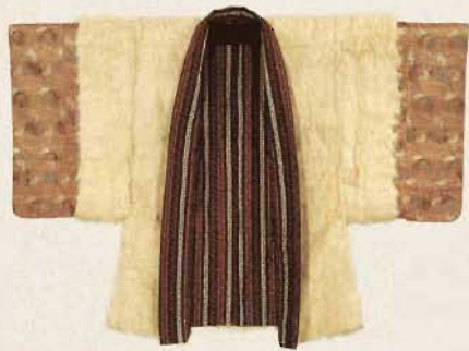
白羊毛皮付き羽織 仕立:江戸時代 18世紀 【後期】

徳川美術館が所蔵する尾張徳川家伝来の日欧貿易関係品は、御三家筆頭の名にふさわしい質の高さと希少性で国内外に広く知られているコレクションです。さらに、名古屋市蓬左文庫にも、江戸時代を通じて日本へもたらされたヨーロッパ由来の人文科学の知識や最新の世界情勢に関する尾張徳川家旧蔵の漢和・洋籍が残されています。 本展は、これまでまとまったかたちで紹介されることのなかったこれらの日欧貿易関係コレクション、書籍、古地図類などを一堂にご紹介します。殿さまたちが触れた当時最先端の「異国」の美や、学問・情報へのまなざしを体験していただければ幸いです。 *会期中、一部展示替えがあります。 【前期】 9月20日(日)～10月11日(日) 【後期】 10月13日(火)～11月3日(火・祝)