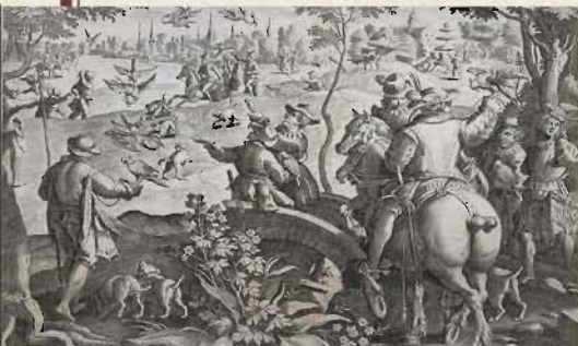
Venationes Ferarum, Avium, Piscium (「阿蘭陀人殺生図」) 104枚 4巻の内(部分) ヤン・ファン・デル・スタート原画 フランドル(アントワープ) 初版1596年 16世紀 【通期、但し場面替えあり】