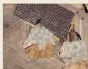
国宝 紫式部日記絵巻 第一段(部分) 五島美術館蔵