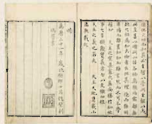
「天主義義」利瑪竇(マテオ・リッチ)撰 上下巻のうち上巻(部分) 中国・明時代 万曆32年(1604) 名古屋市蓬左文庫蔵 【通期、但し頁替えあり】

徳川美術館が所蔵する尾張徳川家伝来の日欧貿易関係品は、御三家筆頭の名にふさわしい質の高さと希少性で国内外に広く知られているコレクションです。さらに、名古屋市蓬左文庫にも、江戸時代を通じて日本へもたらされたヨーロッパ由来の人文科学の知識や最新の世界情勢に関する尾張徳川家旧蔵の漢和・洋籍が残されています。 本展は、これまでまとまったかたちで紹介されることのなかったこれらの日欧貿易関係コレクション、書籍、古地図類などを一堂にご紹介します。殿さまたちが触れた当時最先端の「異国」の美や、学問・情報へのまなざしを体験していただければ幸いです。 *会期中、一部展示替えがあります。 【前期】 9月20日(日)～10月11日(日) 【後期】 10月13日(火)～11月3日(火・祝)