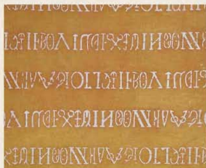
西洋文字文入染革(部分) 江戸時代 18-19世紀 【通期】