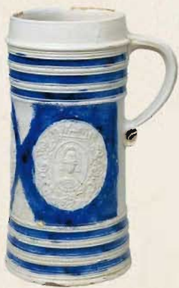
白地藍彩印花人物文フンペン(「阿蘭陀焼手附水指」) ドイツ(ヴェスターヴァルト地方) 16-17世紀 【通期】