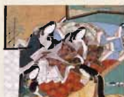
源氏物語絵巻 朝暈(部分) 個人蔵

企画展 読み継がれた源氏物語 11月8日(日)～12月13日(日) 【特別公開】国宝 紫式部日記絵巻 11月8日(日)～12月13日(日)