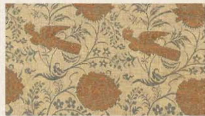
銀地萌黄金入花鳥文蒙流 (部分) インドまたはイラン 17-18世紀 【前期】