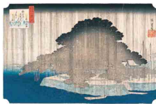
近江八景之内 唐崎夜雨