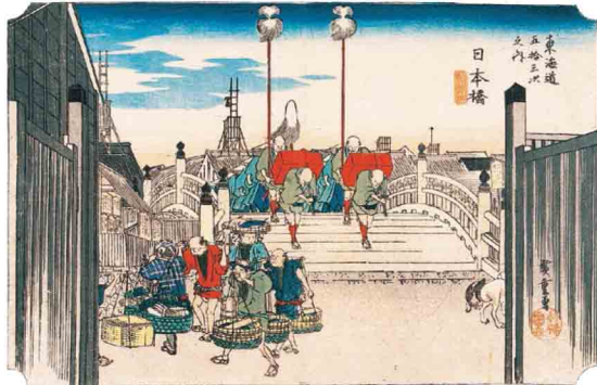
東海道五拾三次之内 日本橋 朝之景(保永堂版)