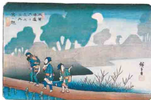
木曾海道六拾九次之内 宮ノ越