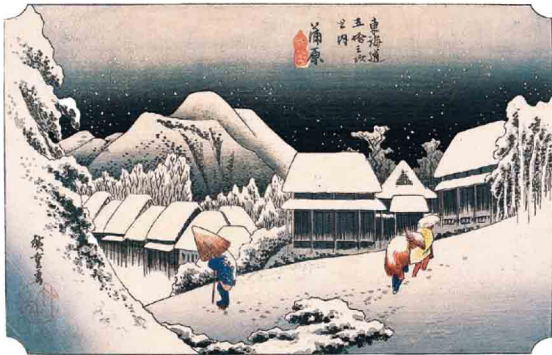
東海道五拾三次之内 蒲原 夜之雪(保永堂版)