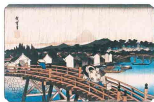
東都名所 日本橋之白雨