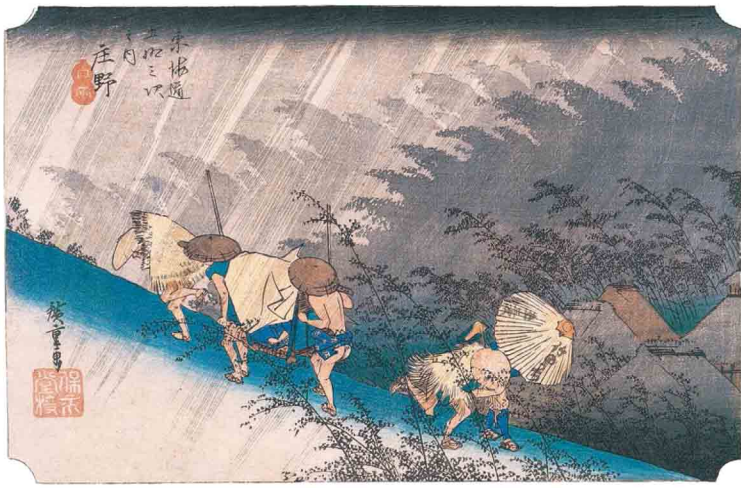
東海道五拾三次之内 庄野 白雨(保永堂版)

風景画の名手歌川広重の代表作である保永堂版「東海道五拾三次之内」全55図に加え、行書版、隸書版、堅絵東海道などの各種東海道絵や、広重のもうひとつの代表的街道絵である「木曾海道六拾九次之内」から作品を紹介します。 また、江戸や近江などの名所絵もあわせて紹介し、広重の風景画の世界をすぐれた個人コレクションとともに堪能いただけます。