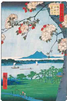
名所江戸百景 隅田川 水神の森真崎