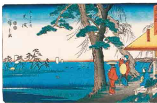
東海道 九 五十三次 大磯(隸書版)