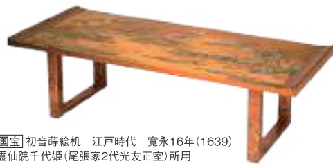
【国宝】初音蒔絵机 江戸時代 寛永16年(1639) 霊仙院千代姫(尾張家2代光友正室)所用