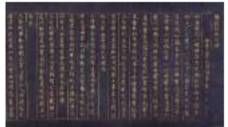
紺紙金字仏説阿弥陀経 成譽廓吞(建中寺第1世)筆 江戸時代 17世紀 建中寺蔵