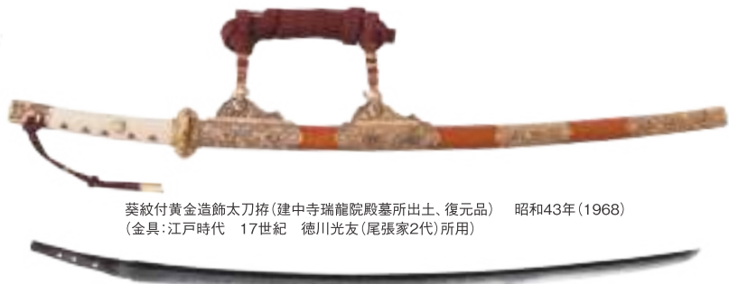
葵紋付黄金造飾太刀拵(建中寺瑞龍院殿墓所出土、復元品) 昭和43年(1968) (金具：江戸時代 17世紀 徳川光友(尾張家2代)所用)