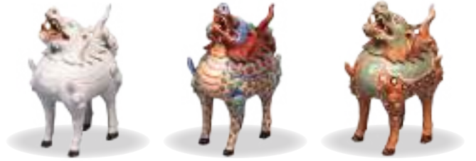
色絵犀形香炉 江戸時代 17世紀 徳川綱誠(尾張家3代)所用 建中寺蔵