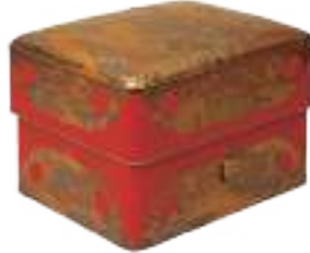
【国宝】初音蒔絵大角赤手箱 江戸時代 寛永16年(1639) 霊仙院千代姫(尾張家2代光友正室)所用