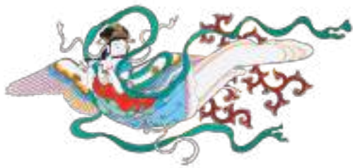
徳川家霊廟 唐門天井画見取図 迦陵頻伽 原本：江戸時代 18世紀 建中寺蔵*