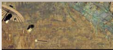
蓬生 平安時代 12世紀 9/22 ~ 10/6