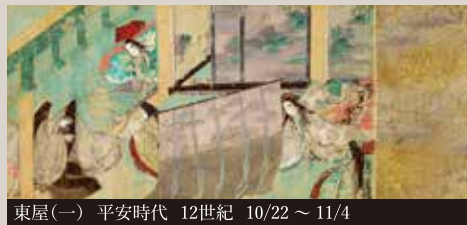
東屋(一) 平安時代 12世紀 10/22 ~ 11/4