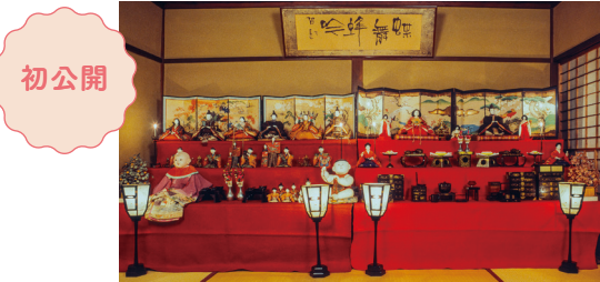
内裏雛飾り 江戸～明治時代 18～19世紀 林駒夫氏寄贈

「桃の節供」と呼ばれる雛まつりは、春のおとずれを告げるにふさわしい、華やかで心なごむ行事です。徳川美術館では毎年、雛まつりの時期にあわせて尾張徳川家伝来の雛飾りを展示しています。気品に満ちた有職雛や、婚礼調度のミニチュアである雛道具は、いずれも雅やかで、御三家筆頭の名にふさわしい質の高さを誇ります。これら江戸時代の品々に加え、明治から昭和にいたる尾張徳川家三世の夫人たちの豪華な雛段飾りも、毎年多くの方が楽しみにしてくださっています。 また、今年は故・林駒夫氏(重要無形文化財「桐塑人形」保持者)からご贈りいただいた、林家ゆかりの雛人形を初公開します。雛人形の歴史に造詣の深い林氏蒐集のお人形や、林家で代々受け継がれ、大切に飾られてきた伝統的な旧家の雛飾りをお楽しみください。