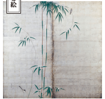
若竹鶴図屏風 田中訥言筆 江戸時代 19世紀 名古屋市博物館蔵 前期