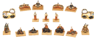
芥子雛 貞徳院姫(尾張徳川家14代慶勝正室)所用 江戸時代 19世紀