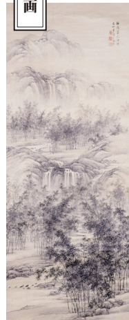
養老飛泉図 山本梅逸筆 江戸時代 弘化元年(1844) 名古屋市博物館蔵 後期