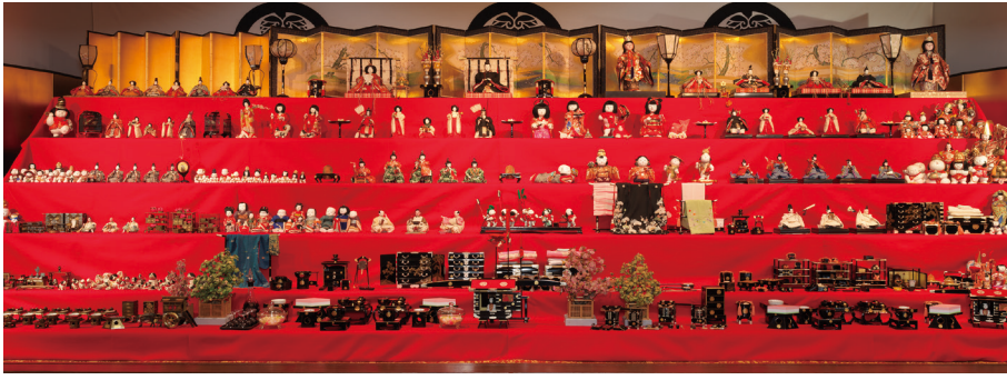
尾張徳川家三世の雛段飾り 明治～昭和時代 個人蔵