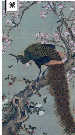
孔雀図 山田宮常筆 江戸時代 18世紀 名古屋市博物館蔵 後期