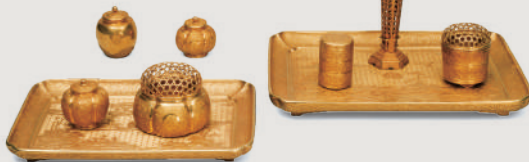
表面 【国宝】初音蒔絵文台・硯箱(部分) 江戸時代 寛永16年(1639) ※表記のない作品は全て靈仙院千代姫(尾張徳川家2代光友正室)所用 徳川美術館蔵