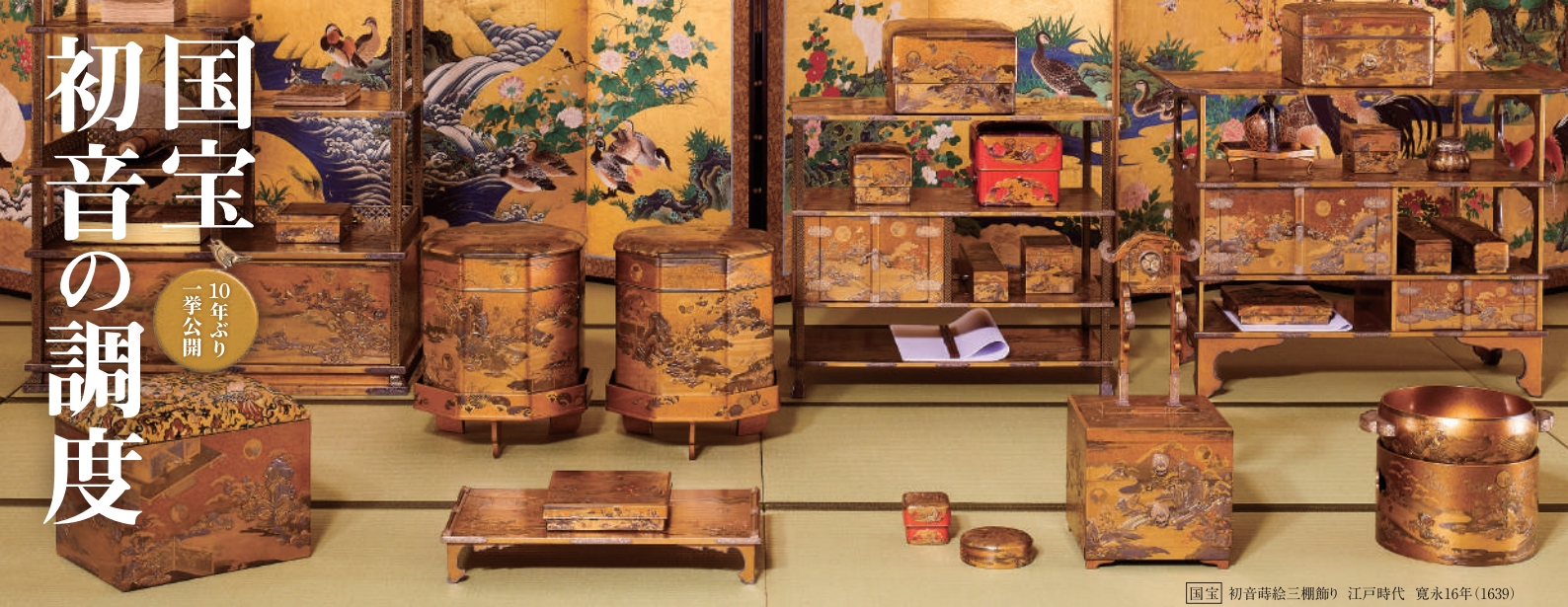
【国宝】初音蒔絵三棚飾り 江戸時代 寛永16年(1639)

国宝「初音の調度」。それは、徳川美術館が所蔵する1万件あまりの多彩な所蔵品の中でも一際、輝きを放つ、世界に誇る不朽の名品です。国宝「初音の調度」は寛永16年(1639)、3代將軍徳川家光の長女・千代姫(1637~98)が、尾張徳川家2代光友に嫁ぐ際の婚礼調度として詠えられました。明治維新や第二次世界大戦などの逸失の危機を乗り越え、計70件が現在まで伝わっており、質・量ともに類例のない、江戸時代を代表する蒔絵の名品として知られています。