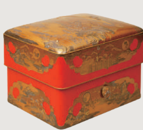
【国宝】初音蒔絵大角赤手箱 江戸時代 寛永16年(1639)

開館90周年の幕開けを飾るにふさわしい、黄金に輝く精緻で豪華な大名婚礼調度、国宝「初音の調度」全点が一堂に会します。