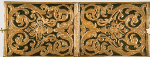
金唐革鏡覆 ハンス・ル・メール作 オランダ 17世紀