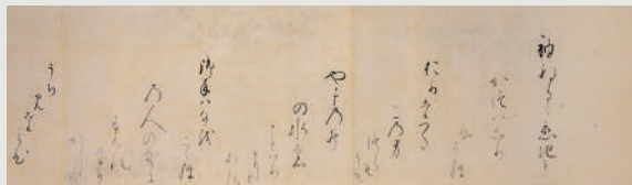
源氏物語抜書 靈仙院千代姫(尾張家2代光友正室)筆 江戸時代 17世紀