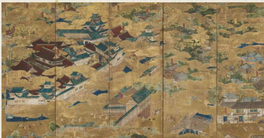
聚楽第図屏風(部分) 桃山時代 16世紀 東京・三井記念美術館蔵【後期】

2026年の大河ドラマ「豊臣兄弟!」は、「彼が長生きしていれば豊臣家の天下は安泰だった」とまで言わしめた豊臣秀長の目線で、戦国時代をダイナミックに描く物語です。本展覧会ではドラマと連動し、豊臣秀長と兄・秀吉、彼らを取りまく織田信長、徳川家康、黒田官兵衛、藤堂高虎、千利休、高台院らゆかりの品々をはじめ貴重な歴史資料を紹介。兄弟の生き様、二人が駆け抜けた時代を浮き彫りにします。